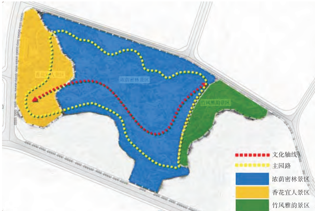
图2 公园总体布局图

主园路。“三区”覆盖全园, 为公园主要游览地, “一轴”是公园的灵魂所在, “一环”把各景区有机串连构成公园的总体布局。