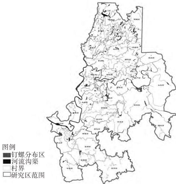
图 1 四川仁寿县郫江河流域钉螺分布

(1) 具有典型的山丘小流域(集水区 Watershed)特征。在山丘区,地貌分异较大,由山脊分水岭分割,形成许多面积大小不一的集水区单元,每个集水区地貌单元相对封闭,环境条件差异性大,有的集水区具有适合钉螺孳生环境,有的集水区没有钉螺分布,即使在同一河流,上游集水区有钉螺分布,下游不一定有钉螺分布,呈现一种以集水区为主的空间不连续分布特点。因此,山丘区空间异质性更大,钉螺分布多呈点状和局部状分布见图 1。